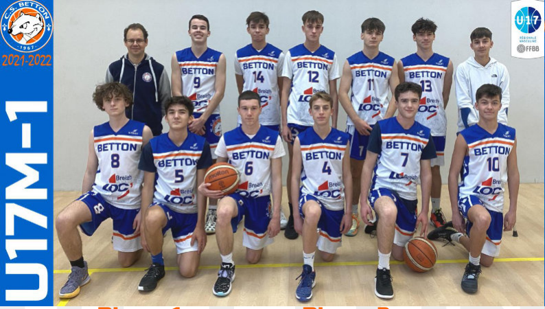
U17M-1 Phase 1 Région 4 ème Phase 2 Région Honneur 1 er