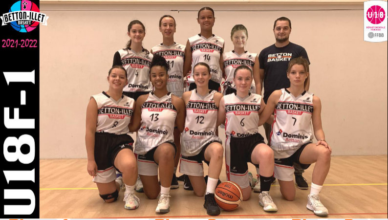
U18F-1 Phase 1 D1 4 ème Phase 2 D1 Excellence 2 ème Phase 3 D1 Excellence