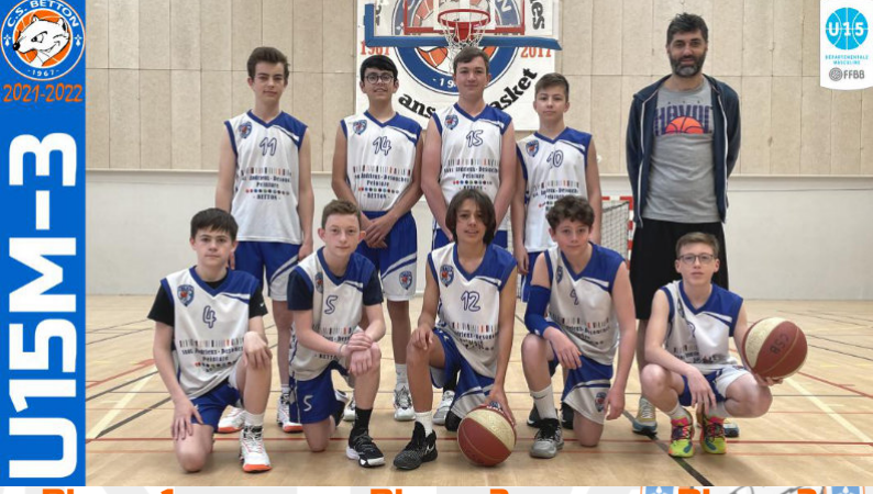
U15M-3 Phase 1 D3 2 ème Phase 2 D3 4 ème Phase 3 D3