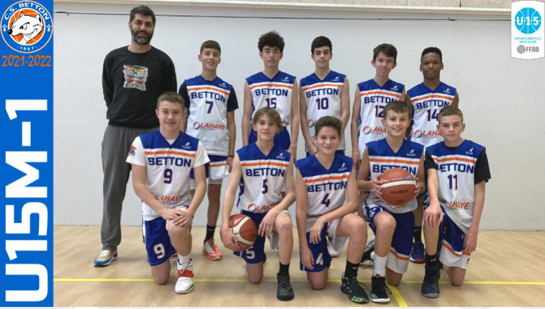
U15M-1 Phase 1 D1 2 ème Phase 2 D1 Elite 1 er Phase 3 D1 Excellence