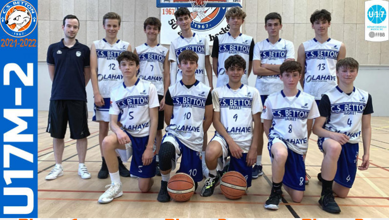
U17M-2 Phase 1 D2 1 er Phase 2 D1 Elite 2 ème Phase 3 D1 Elite