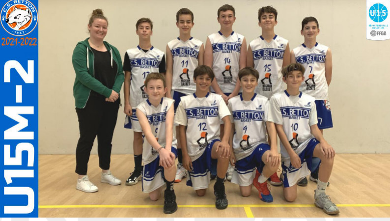
U15M-2 Phase 1 D2 3 ème Phase 2 D2 2 ème Phase 3 D1 Excellence