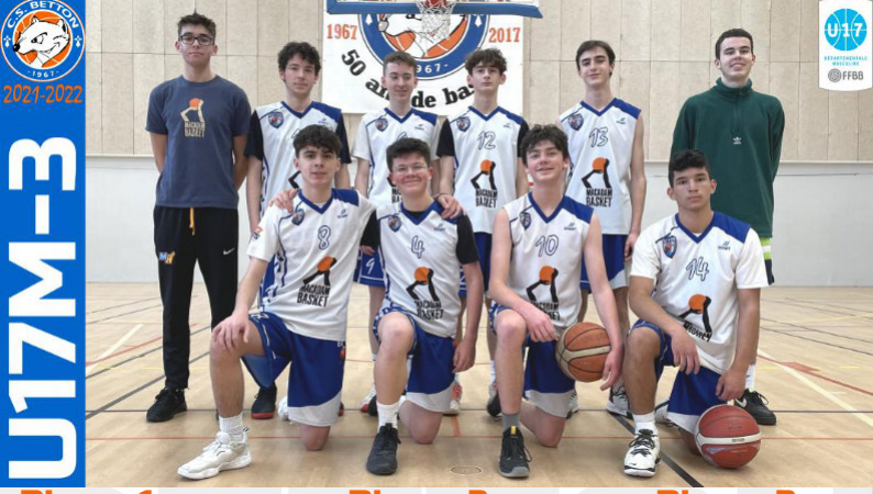
U17M-3 Phase 1 D3 4 ème Phase 2 D3 2 ème Phase 3 D3