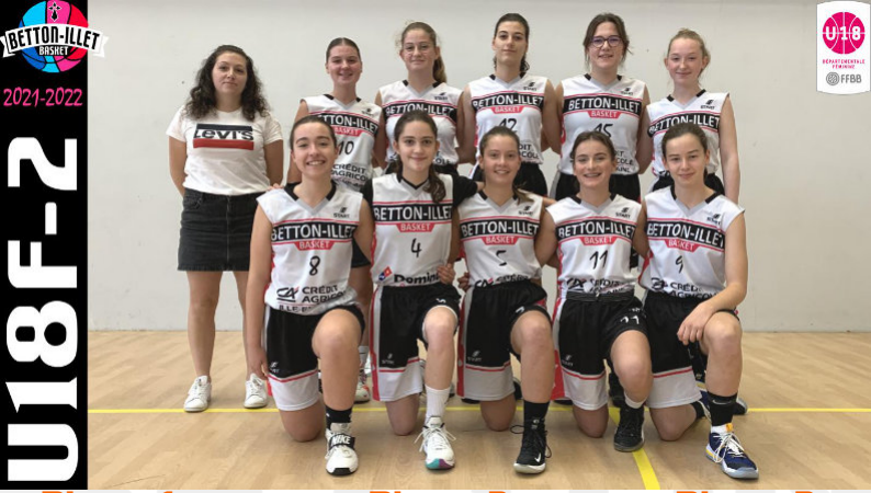
U18F-2 Phase 1 D3 1 ère Phase 2 D2 2 ème Phase 3 D2