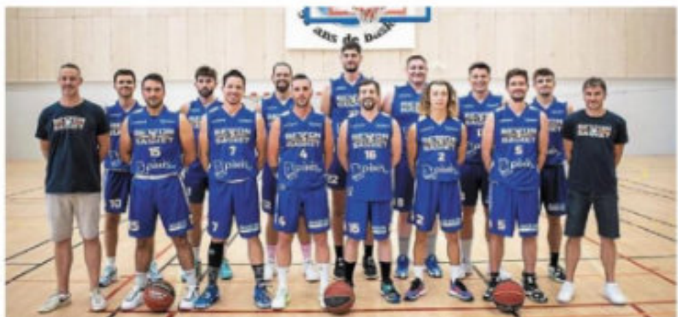
Le club de basket évolue en Nationale 3 chez les garçons, avec l'envie de s'y installer dans le durée.

Le club avance dans la sérénité, avec des commissions qui fonctionnent parfaitement. « Nous ne voulons pas que le bénévolat rime avec contrainte ou corvée. Ce qui nous impose d'être nombreux à nous investir. Et c'est chose faite »,